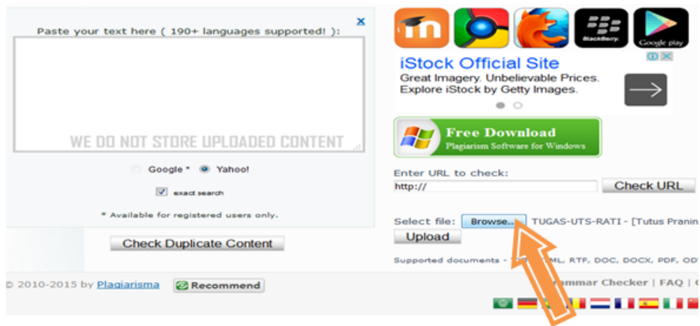
Gambar 4.3 Step 2 Click “Browse”