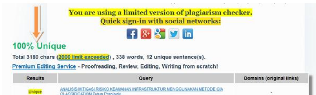
Gambar 4.5 Step 4, hasil dari scan plagiat, jika keterangan 100% unique, maka tingkat orisinalitas 100%, minimal untuk dapat diajukan bimbingan 85%