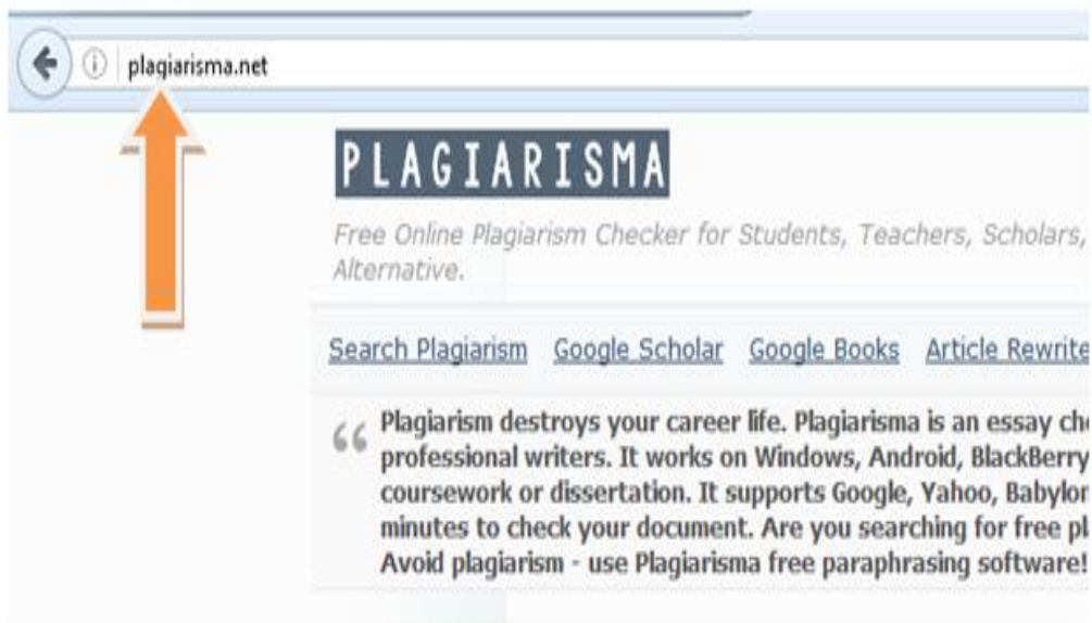
Gambar 4.2 Step 1